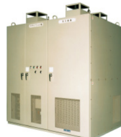
アクティブフィルタ