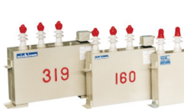
電力用コンデンサ