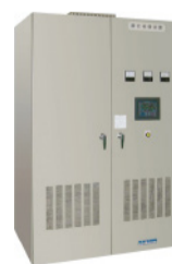
瞬低・停電補償装置