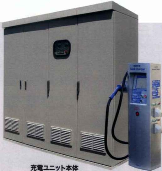
充電ユニット本体