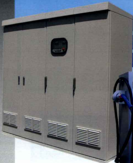
充電ユニット本体