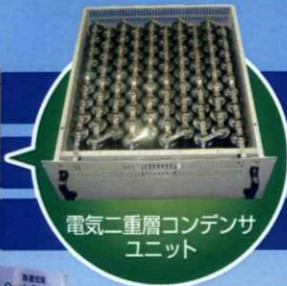
電気二重層コンデンサ ユニット