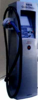
急速 / 普通充電スタンド

太陽光エネルギーだけで電気自動車に急速充電できます 急速充電 1 台、普通充電 2 台の計 3 台を同時に充電できます